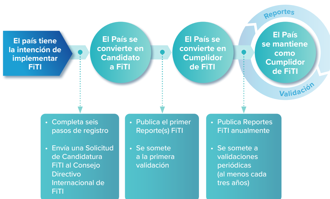
Figura 1: De la intención, a País Candidato de FiTI, a País Cumplidor de FiTI

Un GMA Nacional debe publicar su primer Reporte FiTI dentro del año siguiente de convertirse en un país candidato a FiTI. Posteriormente, los países implementadores deben publicar Reportes FiTI anualmente.